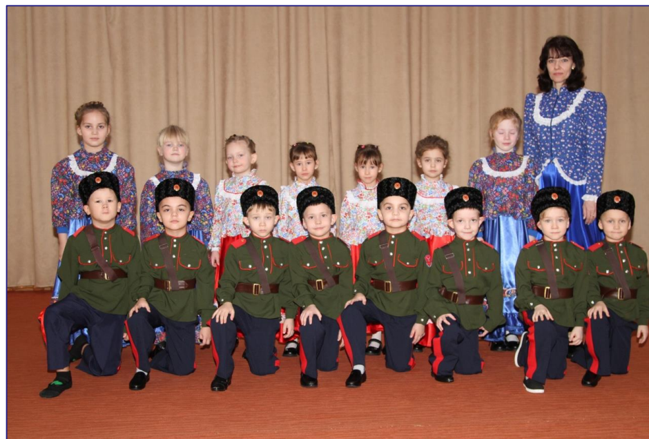
Педагоги и воспитанники МБДОУ «ДСОВ «Северяночка»

Всероссийский фестиваль-конкурс Всероссийского казачьего общества «Во славу Отечества!»