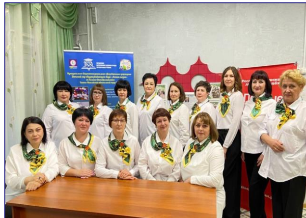
МБДОУ «ДСОВ «Лесная сказка» - победитель Всероссийского Конкурса «Лучшие детские сады России – 2024»