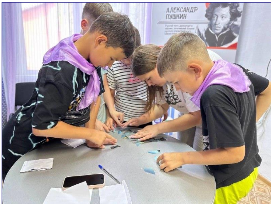
Лагерь на базе МБОУ «Андринская СОШ»