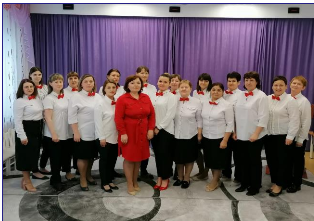
МБДОУ «ДСОВ «Аленький цветочек» - победитель всероссийского смотря-конкурса «Образцовый детский сад – 2024»