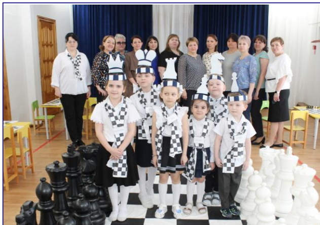
МАДОУ «Радуга» - победитель всероссийского смотря-конкурса образовательных организаций «Достижения образования»