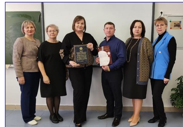
МБОУ «Перегребинская СОШ» внесена во Всероссийский реестр «Всероссийская Книга Почета»